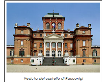
Veduta del castello di Racconigi